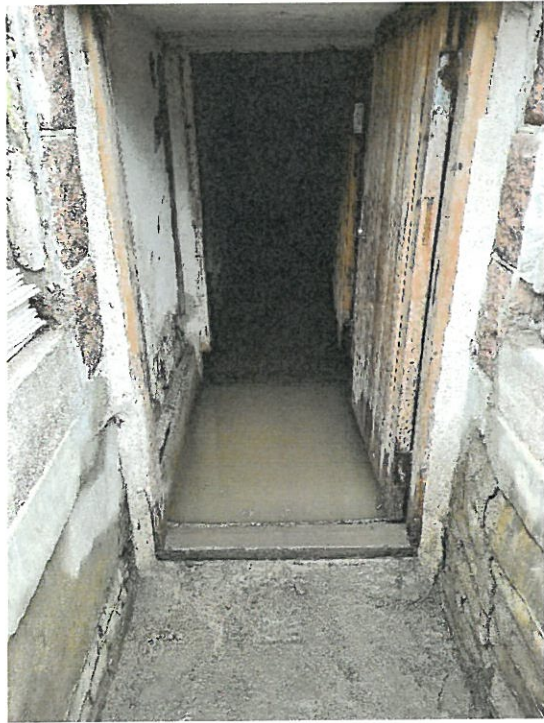
Kuvat: 3.7.2023 (yv), 11.8.2024 (yo), 27.9.2024 (av)